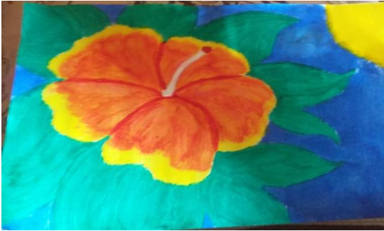
By: Francis Eric C. Bael

Panuto: Pag-aralan ang mga larawan sa ibaba. Bilugan ang mga larawan na nagpapakita o ginagamitan ng basic sketching, shading at outlining. Sa ibaba ng larawan ay sumulat ng pangungusap sa naging epekto ng paggamit ng basic sketching, shading at outlining sa larawang binilugan.