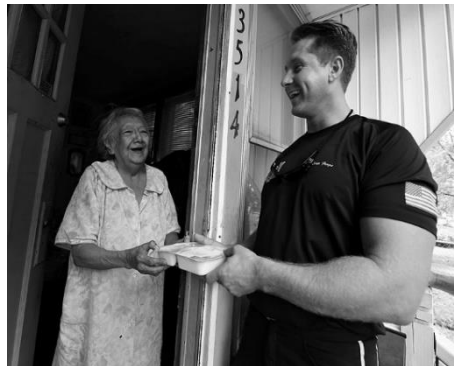
Sailor delivers Meals-on-Wheels to elderly and homebound residents.