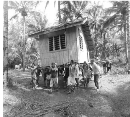
By Bonvallite - Own work, CC BY-SA 3.0, https://commons.wikimedia.org/w/index.php?curid=23522958