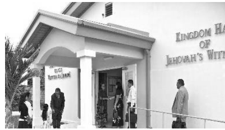
http://piliptomirror.com/wp-content/uploads/2018/06/catholic.jpg June 8, 2018