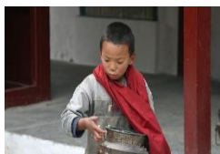
Boy carrying a metal container in Nepal Date: 11 November 2009

Tingnan ang mga larawan sa ibaba. May isang bata na inuutusan ng kanyang Tatay na mag-igib ng tubig sa balon. Kulayan mo ang daan na dadaanan ng bata mula sa bahav papuntana balon.