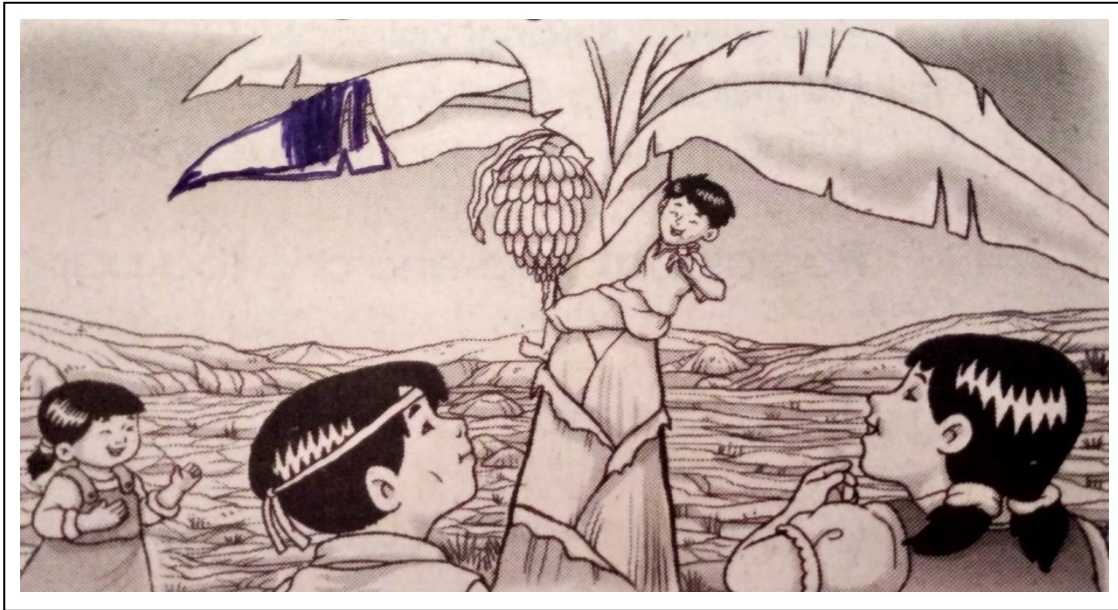
Figure 1 Pinagyamang Pluma Wika at Pagbasa p.35

Panuto: Ipahayag sa iba't-ibang pangungusap ang makikita sa larawan.