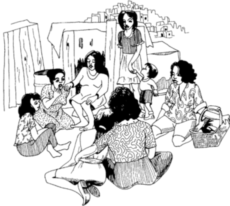
Kasiyahan sa Pagtulong sa Kapuwa