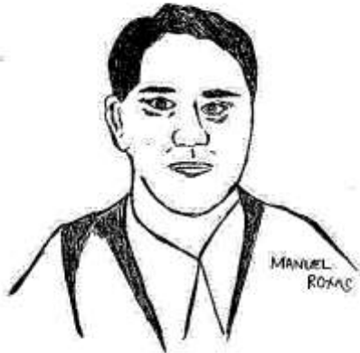
A. Manuel Roxas (1946-1948)