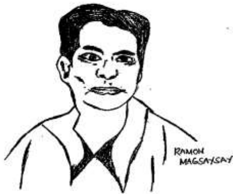
C. Ramon Magsaysay (1953-1957)