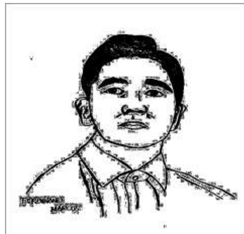
F. Ferdinand Marcos (1965-1972)