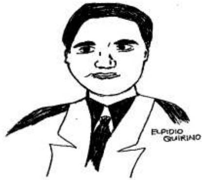
B. Elpidio Quirino (1948-1953)