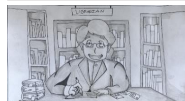
Katiwala ng Aklatan

D. siya ay pumupasok sa paaralan upang mag-aral at matuto sa iba't-ibang mga aralin.