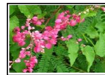
Kadena de Amor