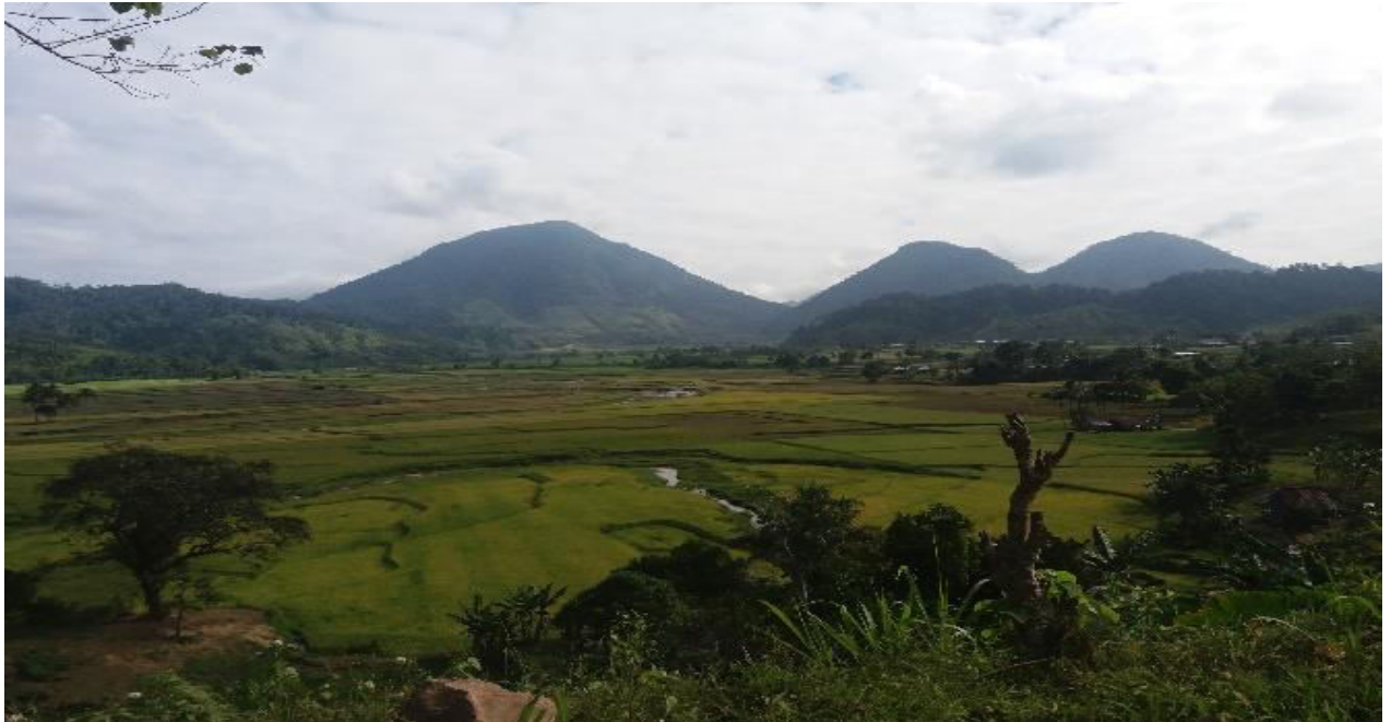
Bundok Pinukis, Lison Valley, Pagadian City

Isa na dito ay ang Bundok Pinukis na matatagpuan sa Lison Valley, Pagadian City, Zamboanga del Sur. Ang taglay nitong ganda ay maaring gawing paksa sa pagpinta ng larawan.