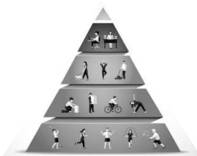
Activity Pyramid Guide

Ang target game o larong pagtudla ay isang uri ng laro kung saan ang manlalaro ay sumusubok na ihagis, i-slide o i-swing ang pamato upang maabot o matamaan at madala o makuha ang target sa isang itinalagang lugar. Ang target games ay maaring isahan o pangmaramihan. Ilan sa mga kilalang target games na isahan ay palo sebo, luksong baka, sipa, billiards , bowling , golf , tatsing at batuhang bola. Ang tumbang preso, Bati-Cobra, Luksong Tinik, Ubusan ng Lahi, Siyato, Football, Soccer, Baseball at frisbee naman ay mga halimbawa ng target games na pangmaramihan.