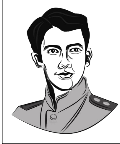
General Gregorio H. del Pilar