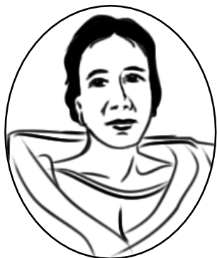
Gregoria de Jesus

Tingnan ang mga larawan sa ibaba. Sila ang kababaihang naging bahagi ng pag-aalsa laban sa mananakop na Español. Alamin kung ano ang kanilang naging bahagi sa pag-aalsa laban sa mananakop na Español.