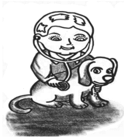
Pagtingin ng kalusugan ng alaga

Gamit ang mga uri ng pag-aalaga, kumpletuhin ang iskedyul na nasa ibaba.