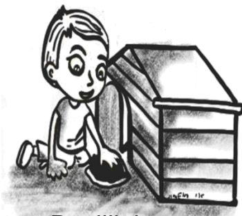
Paglilinis ng kulungan ng alaga