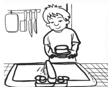
Paghuhugas ng mga kasangkapan