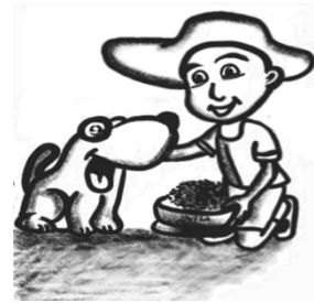
Pagpapakain ng alagang hayop