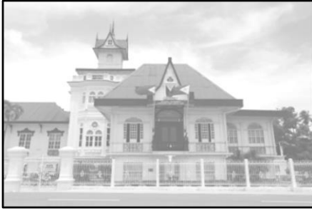
Lumang Bahay ni Heneral E. Aguinaldo

Mga lumang bahay na ginawa daang taon na ang nakalilipas sa ibat-ibang dako ng Pilipinas ay karaniwang yari sa bato at adobe. Ang mga bintana ay malalaki at pinapalamutian ng kapis. Malalaki ang mga pinto. Maluluwang ang mga silid kabilang dito ay lumang bahay ni Heneral Emilio Aguinaldo sa Kawit Cavite.